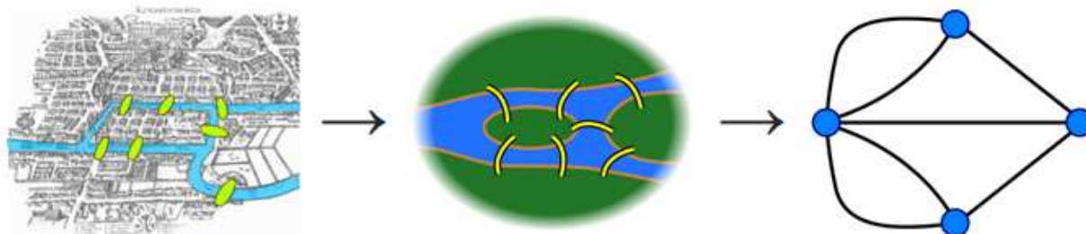
( https://fr.wikipedia.org/wiki/Problème_des_sept_ponts_de_Königsberg )

La ville de Königsberg (aujourd'hui Kaliningrad) est construite autour de deux îles situées sur le Pregel et reliées entre elles par un pont. Six autres ponts relient les rives de la rivière à l'une ou l'autre des deux îles, comme représentés sur le plan ci-dessus. Le problème consiste à déterminer s'il existe ou non une promenade dans les rues de Königsberg permettant, à partir d'un point de départ au choix, de passer une et une seule fois par chaque pont, et de revenir à son point de départ, étant entendu qu'on ne peut traverser le Pregel qu'en passant sur les ponts.